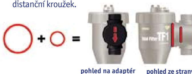
pohled na adaptér pohled ze strany

Pro montáž do svislého potrubí se směrem proudění shora dolů přidejte červený O-kroužek a červený distanční kroužek.