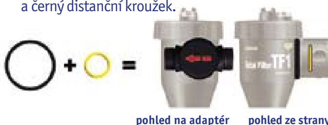
pohled na adaptér pohled ze strany

Pro montáž do vodorovného potrubí se směrem proudění zleva doprava přidejte žlutý O-kroužek a černý distanční kroužek.