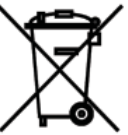
WEEE Registration Number: 02771/07-ECZ

Do not dispose of this product as unsorted municipal waste. Please dispose of this product by returning it to the point of sale or to your local municipal collection point for recycling. Respecting these rules will help to preserve, protect and improve the quality of the environment, protect human health and utilise natural resources prudently and rationally. The crossed out wheeled bin with marking bar, printed either in the Manual or on the product itself, identifies that the product must be disposed of at a recycling collection site.