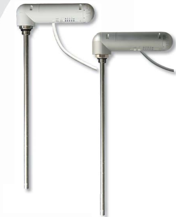
Electric Heating Elements with Thermostat 100 - 1500 W