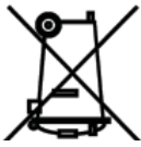
Evidenční číslo výrobce: 02771/07-ECZ

Tento spotřebič nesmí být likvidován spolu s komunálním odpadem. Musí se odebrat na svém místě tříděného odpadu, nebo ho lze vrátit při koupi nového spotřebiče prodejci, který zajišťuje sběr použitých přístrojů. Dodržováním těchto pravidel přispějete k udržení, ochraně a zlepšování životního prostředí, k ochraně zdraví a k šetrnému využívání přírodních zdrojů. Tento symbol představuje a podřízené popelnice v návodu nebo na výrobku znamená povinnost, že se spotřebič musí zlikvidovat odevzdáním na svém místě.