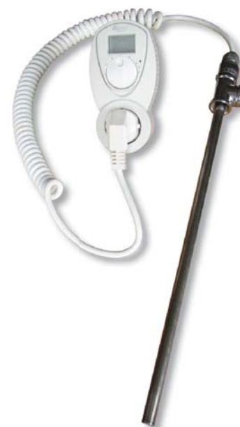
Kit for bathroom towel radiators (electric heating element and TZ 33 electronic plug-in thermostat)